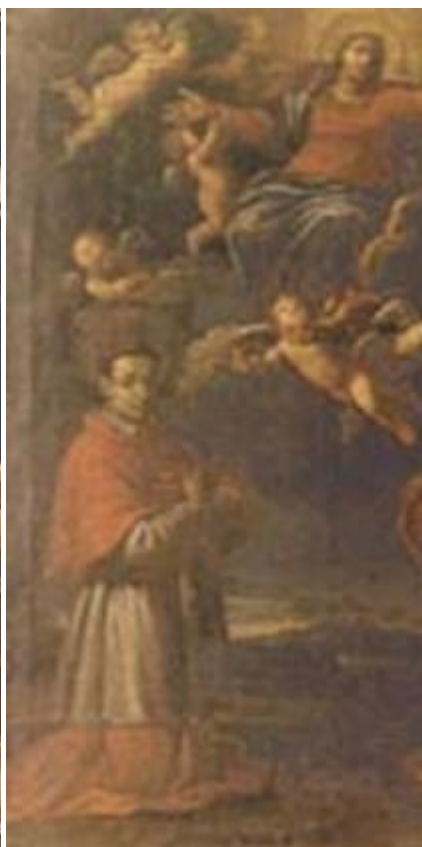
Tela: Ignoto Assunzione della Vergine con i Ss. Carlo Borromeo e Giovanni Battista

Misure: cm 127 x 174 La tela è stata restaurata a cura della Soprintendenza del Friuli - Venezia Giulia nel 1986. Notevoli i colori brillanti.