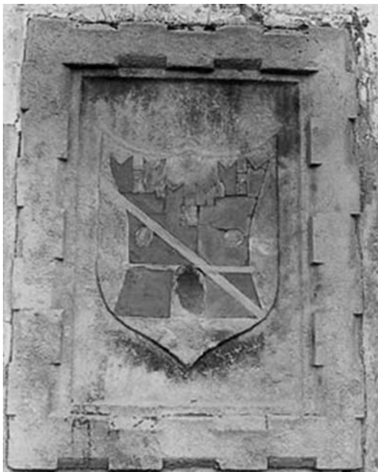
Lo stemma del Comune di San Vito, sulla facciata del Duomo