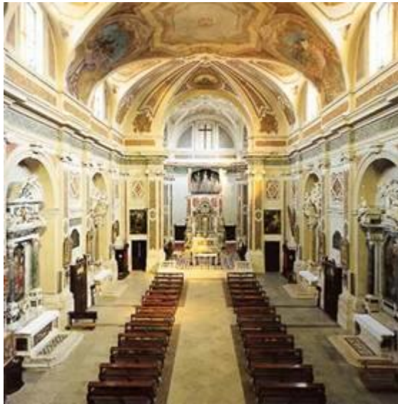
Interno del Duomo