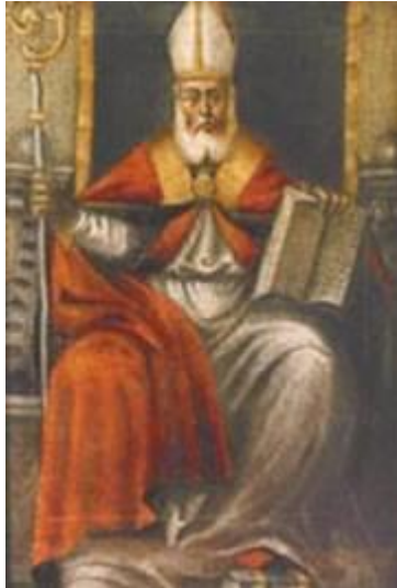
Tela: Ignoto, Un Vescovo che regge nella mano destra un pastorale e con l'altra sostiene un codice, appoggiato sulle ginocchia. Misure: cm: 63.5 x 43.5