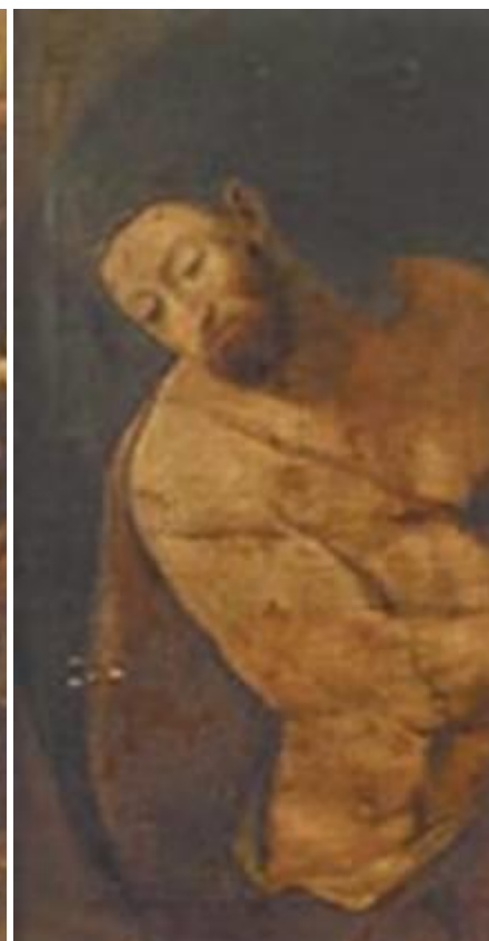
Tela: Ignoto (sec. XVII?) Cristo incoronato di spine. Misure: cm: 89 x 74

Misure: cm 60.5 x 50.5 Interessante anche la cornice intagliata.