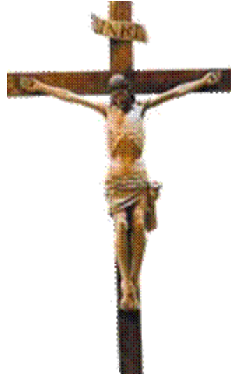
In Presbiterio: Crocifisso ligneo, autore locale anonimo del sec. XVI. Misure: cm 140x130 La croce è alta cm 260. Restauro: A. e A. Comoretto 1995.

Sopra la porta che dal vano scale dà nel retrocoro, è inserito un medaglione di marmo con busto in bassorilievo raffigurante il sanvitese