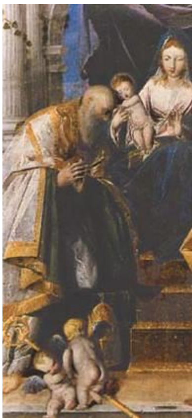
Tela: Ignoto (forse sec. XVI) Madonna in trono con il Bambino e due Santi (S. Vito e S. Nicolò).