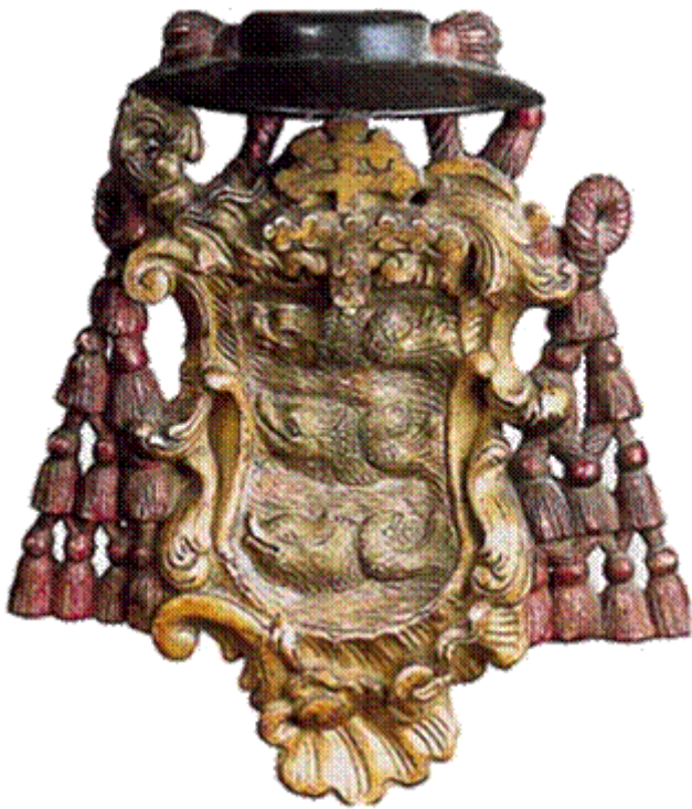
Stemma del Patriarca

era contemporaneamente libera Comunità e feudo patriarcale. I sanvitesi furono sempre gelosi delle loro libertà e dei loro privilegi, che Venezia riconfermò nel 1420.